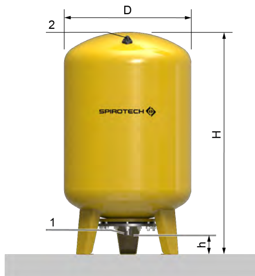
EVU10-120 .. EVU10-300